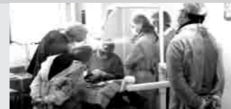
CIRUGÍAS EN DIRECTO